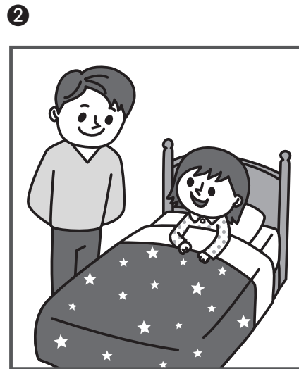
おやすみ (おやすみなさい)