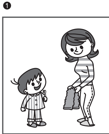
おはよう (おはようございます)